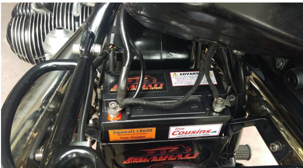
LB600 monteret på BMW R80