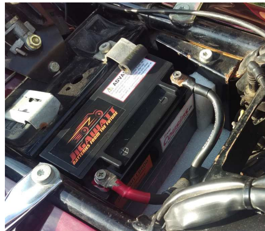
LB600 monteret på Harley Road King (1.540 ccm)